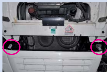
Kaksi simalube® voiteluannostelijaa asennettu DAF XF105 vetoautoon