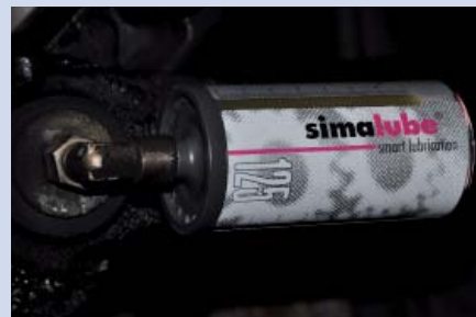
Kuvassa hyttiin paikalle asennettu simalube® 125ml voiteluannostelija